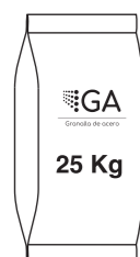
Bolsas plasticas de 25 kg