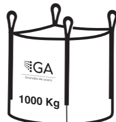
Big bags de 1000 Kg

Desde 1962 fabricando abrasivos de calidad superior